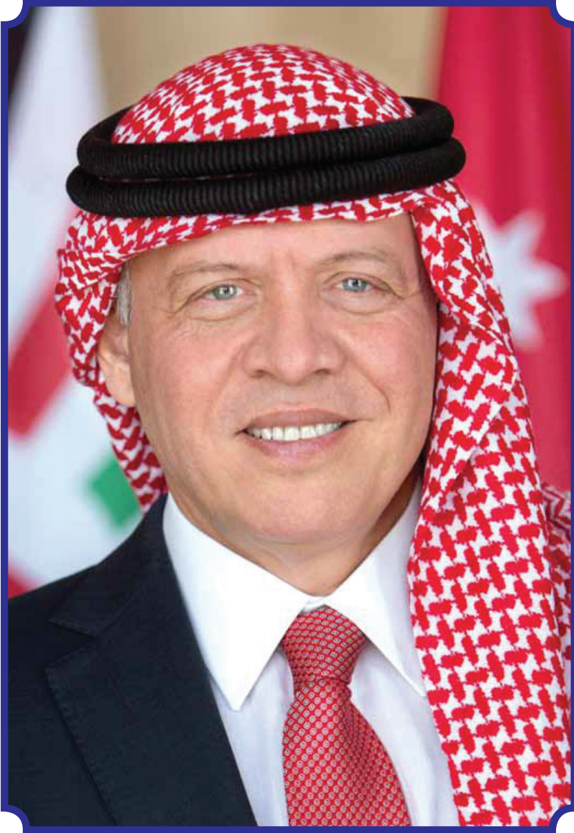
حضرة صاحب الجلالة الهاشمية الملك عبد الله الثاني بن الحسين المعظم